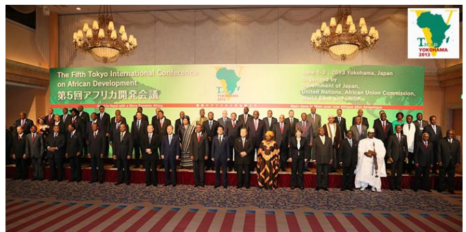
Photo de famille des participants à la TICAD V

Dans ce document, les dirigeants africains et japonais s'engagent, notamment, à promouvoir l'investissement privé, grâce à une amélioration du climat des affaires et des cadres juridiques, à accélérer le développement des infrastructures, à aider à une autonomisation des agriculteurs, principaux acteurs économiques en Afrique.